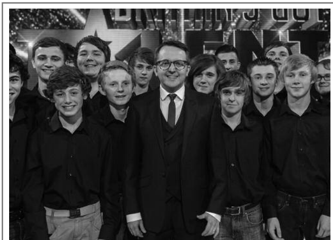
«Only Boys Aloud» : 3ème place au concours télévisé Britain's Got Talent 2012.

Chanter, coûte que coûte. S'il est une passion que les Gallois aiment partager plus que tout, c'est bien celle-ci. Et quand on parle ici de Gallois, on ne parle pas de Galloises ! Dans ce pays où l'histoire est étroitement liée au développement et au déclin de l'industrie minière, le chant est avant tout une affaire d'hommes et chacun des 6 000 ou 7 000 membres de cette armée vocale est fils ou petit-fils de mineur. Le chant : une seconde nature chez les Gallois !